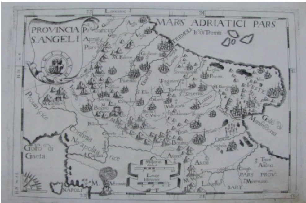
La Provincia monastica Sancti Angeli (incisione dall'Atlante di Giovanni Montecalerio - 1712)

Immutata resta invece l'organizzazione amministrativa delle provincie monastiche. La Capitanata e il Molise fanno parte della provincia di Monte S. Angelo del Gargano.