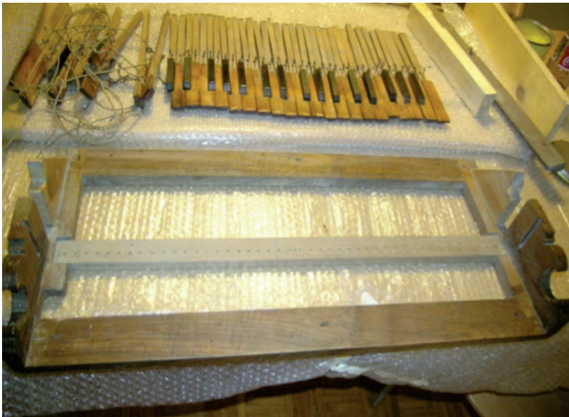
La tastiera durante i lavori di restauro

Le catenacciature sono state disossidate, pulite e regolate, al fine di eliminare ogni tipo di attrito; nel caso di cedimenti o incrinature si è provveduto alle dovute riparazioni. Analoga cura è stata posta nel restauro della meccanica