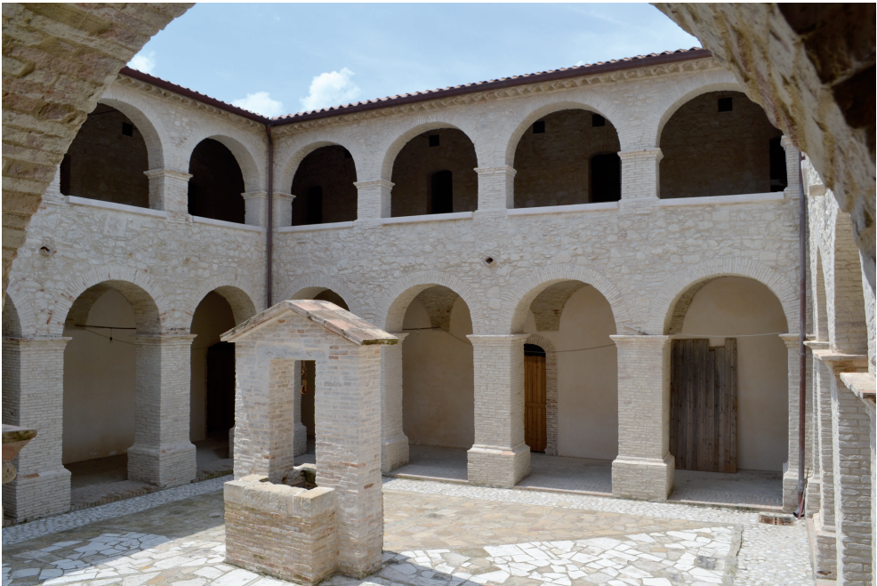
Deliceto - Convento di Sant'Antonio - Il chiostro