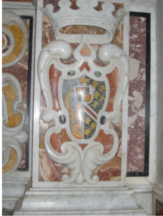
Deliceto, chiesa di S. Antonio, altare maggiore: stemma dei Miroballo e dei Filomarino; in cuore, lo stemma aragonese