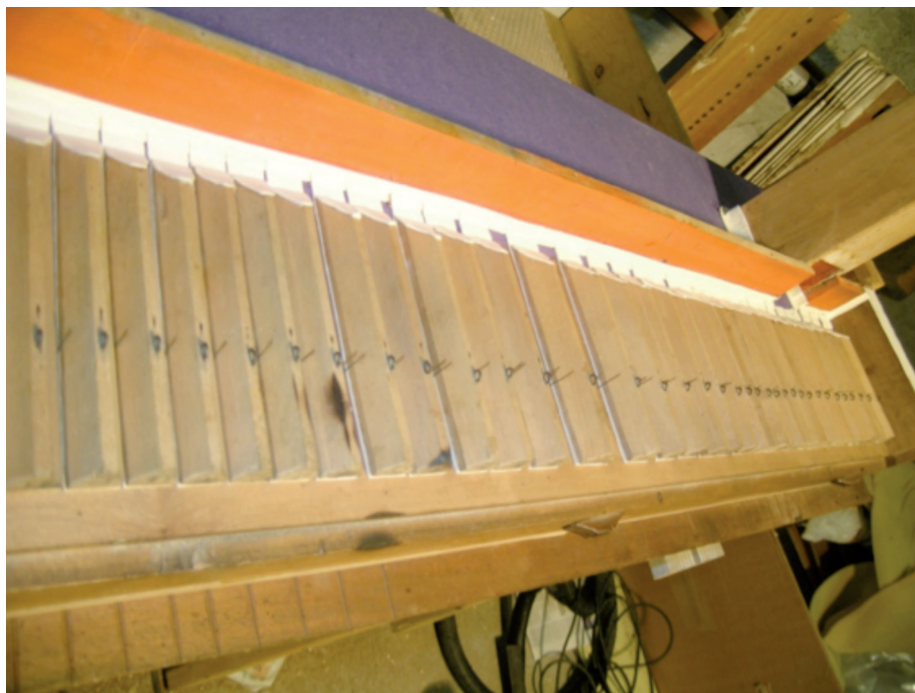
Il somiere restaurato

ma, come già detto, la soffieria elettrica non metterà fuori uso quella originale a mano, che in particolari occasioni potrà altresì essere azionata. Sono stati riutilizzati i pesi ritrovati, costituiti da mattoni, che hanno fornito una pressione di 51 mm. di colonna d'acqua.