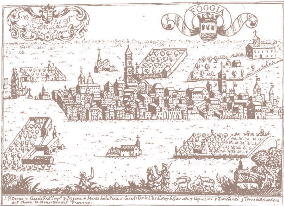
Foggia in una incisione del 1703 tratta da G.B. Pacichelli, Il Regno di Napoli in prospettiva

Sulla spinta del mercato favorito sostanzialmente dal commercio della lana e del grano, altre iniziative commerciali si erano affermate a Foggia nei secoli della transumanza. Culmine e quasi emblema di questa intensa attività commerciale era la famosa fiera primaverile. “Prima della traslazione della R. Dogana in questo luogo, vi fu un tempo in cui in Foggia vi erano due fiere, ma poi si è ristretta ad una fiera, la quale comincia dal 20 del mese di aprile e dura per un mese intero, a tutto il 20 maggio; nel qual tempo cessa la giurisdizione del R. Governatore et in quella vi succede il Mastro Giurato, il quale, non essendo Dottore approvato a Regie Giudicature, si eligge un Dottore a suo arbitrio, e tiene tutta la giurisdizione civile e criminale. Durante la fiera non vi sono dazi per li forestieri” 9 .